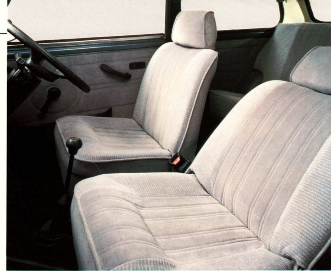
Aufwendig ausgestattet, der Austin Mini Mayfair Sport: z. B. mit Lederlenkrad, Drehzahlmesser.

Eine Menge Auto fürs Geld. Und jede Menge Fahrvergnügen. Der Mini ist in seinen Details eben ganz groß.