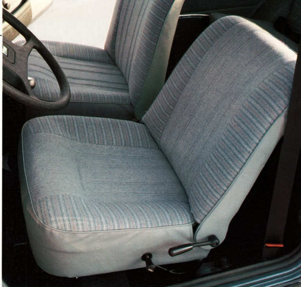
Von diesem Platz aus haben Sie Ihren Austin Mini HLE immer sicher im Griff.