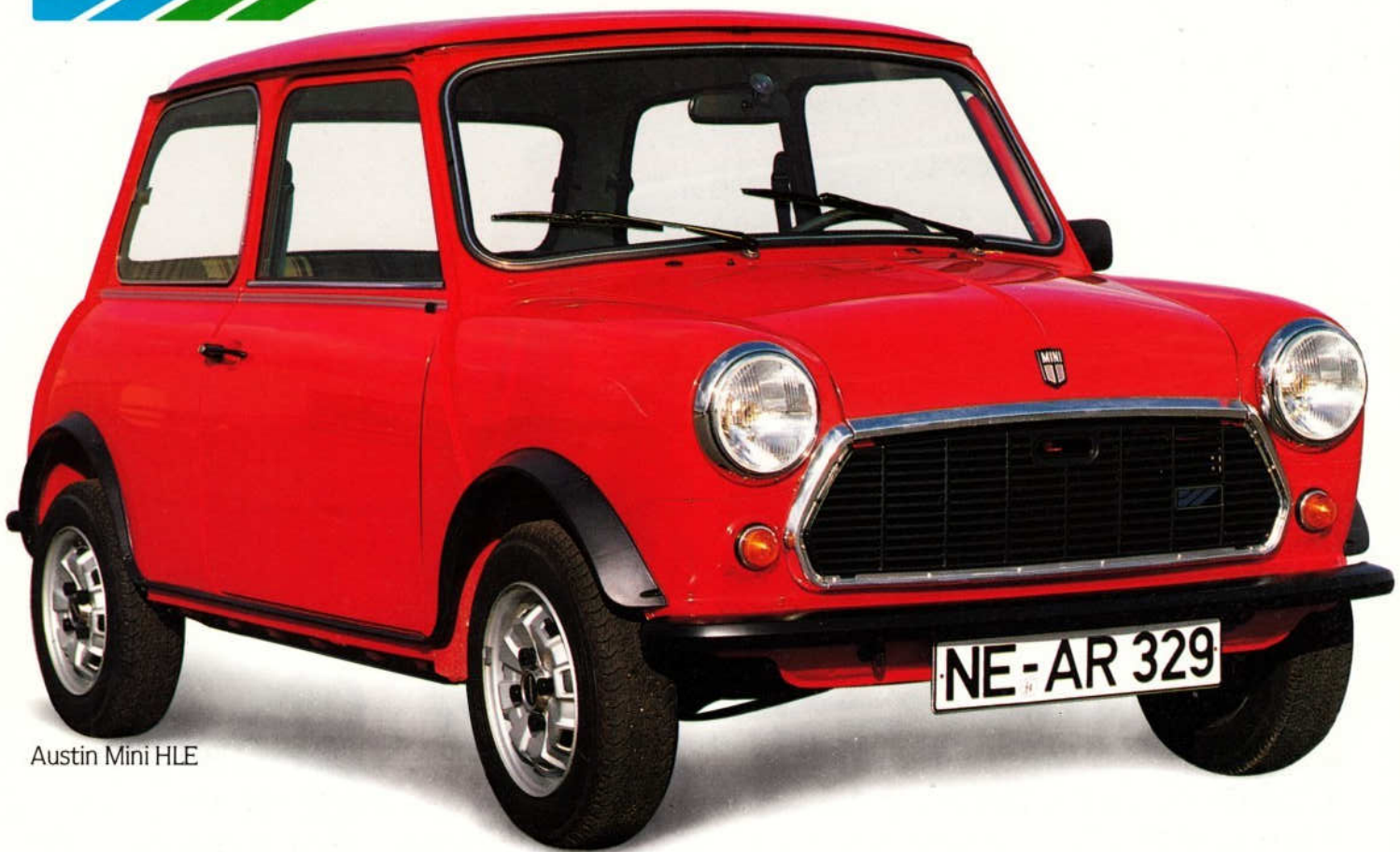
Austin Mini HLE