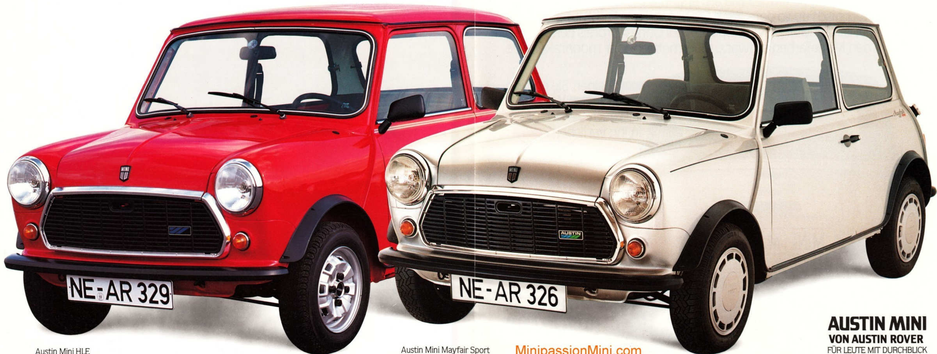
Austin Mini HLE