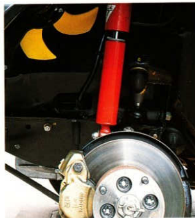
Abb. 4 Sportfahrwerk