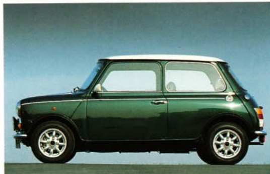
Abb. 3 12"-Mini-Lite-Felge