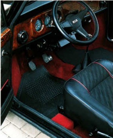
Abb. 3 Gummimatte