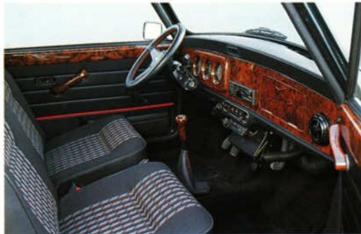
Abb. 3 Wurzelholz-Armaturenbrett