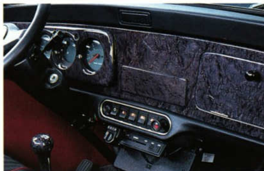
Abb. 4 Vogelaugenahorn-Holzarmaturenbrett

Edel und sportlich geht es im Innenraum zu: das ergonomisch geformte 3-Speichen-Lederlenkrad, mit hochwertigem Leder einteilig bezogen und mit Handkrenznaht veredelt ( \varnothing 340 mm; Abb. 1) oder das Holzlenkrad mit eingelegtem, farblich abgestimmtem Edelholzring ( \varnothing 360 mm; Abb. 2); Ästhetik par excellence vermitteln die Holzarmaturenbretter aus Wurzelholz oder anthrazitfarbenem Vogelaugenahorn (Abb. 3 und 4). Und für ein ungetrübbtes Klangvergnügen in Ihrem MINI gibt es selbstverständlich auch die passende Radiokonsole (Abb. 5 und 6).