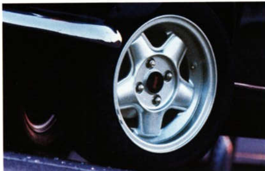
Abb. 2 13"-5-Stern-Revolution-Felge

Ganz schön rasant: Der MINI mit der Mini-Lite- oder der 5-Stern-Revolution-Felge. Komplettiert wird das sportliche Design durch den Spoilersatz, bestehend aus Stoßstange, Kotflügelverbreiterung und Seitenschweller, sowie den Fernscheinwerfern und Nebelschlußleuchten (Abb. 1-3). Dabei wird es den qualitätsbewußten MINI-Fahrer freuen, daß der Body-Kit aus hochwertigem PUR-R-RIM-Material besteht. Höchste Qualität für höchste Ansprüche und höchsten Fahrgenuß.