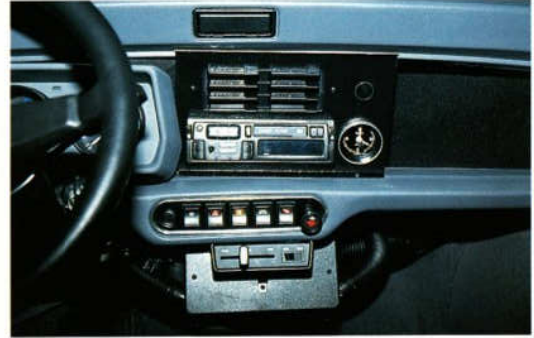
Abb. 5 Radiokonsole und Zeituhr