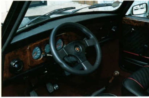
Abb. 1 Lederlenkrad „ERGO“