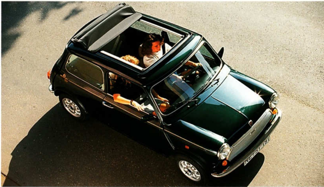
Elektrisches Faltdach Z 314500