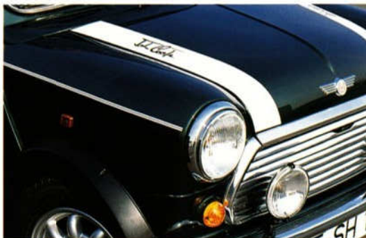
Abb. 3 Zierstreifensatz „John Cooper“