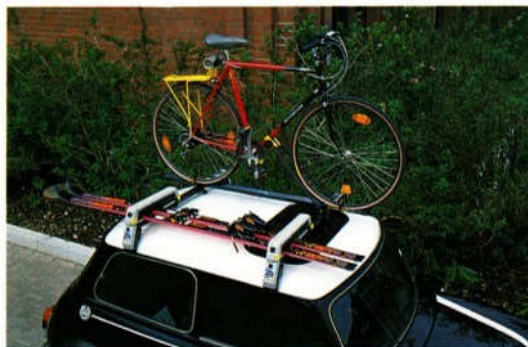
Abb. 1 Fahrrad- und Skiträger