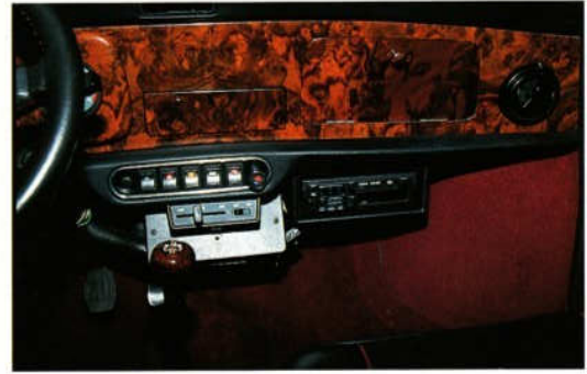
Abb. 6 Unterbaukonsole für Radio