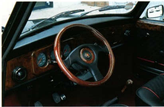
Abb. 2 Lederlenkrad „ELEGANZ“