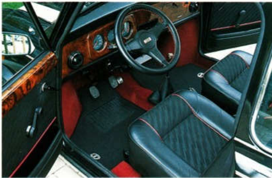
Abb. 1 Veloursmattensatz „Cooper“, schwarz