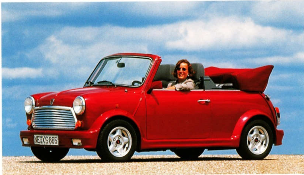
Abb. 1 Spoilersatz und 12"-Revolution-Felge