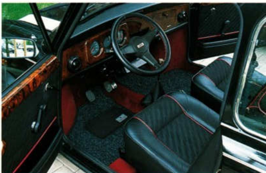
Abb. 2 Veloursmattensatz, graphit