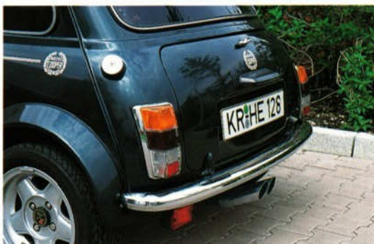
Abb. 4 Sportauspuff