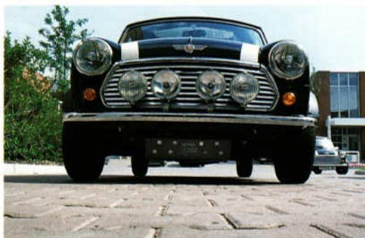
Abb. 2 Cooper-Grill, H4-Einsätze für Hauptscheinwerfer, Zusatzscheinwerfer, Ölwanenschutz