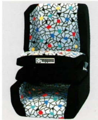
Abb. 4 Kinder-Sicherheitssitz

Veloursmattensatz, schwarz mit „Cooper“-Logo EAH 10110 E Veloursmattensatz, graphit Z 1101 MIN Gummimatte, vorn, schwarz GAC 4500 A (1 St.)